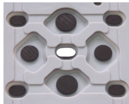
Ansicht eines reparierten Gummileitpads

Das Leitpad auf die schadhafte Gummi-kontaktfläche positionieren und leicht anpressen.